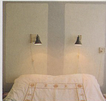
Donker huis? Schilder kleurvlakken op de muur: 'Alsof er zonlicht naar binnen valt.'