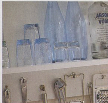
'Ik krijg elk jaar van iedereen blauw en groen glas voor mijn verjaardag.'