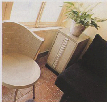
Stoeltje van Ikea; het ladenkastje is van het advocatenkantoor dat hier gevestigd was.